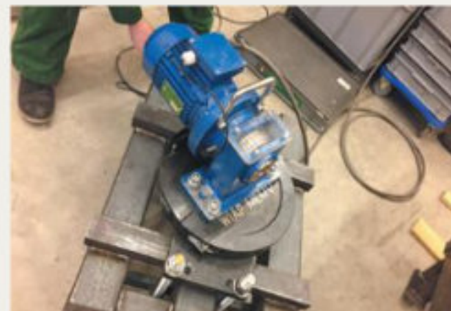
33.kép: Rögzítés szupportcsavaroseljárással, Dulliken - 2018 február (hpw)