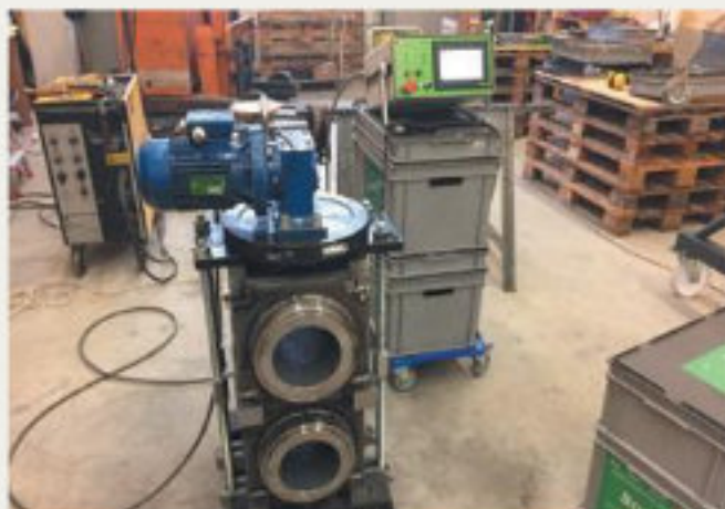
34.kép: Rögzítés duplasupportcsavaros eljárással, Dulliken - 2018 február (hpw)