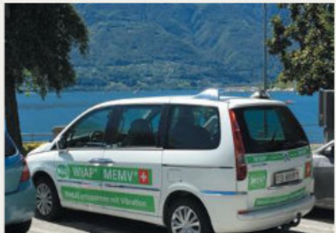
38.kép: Kirándulás a hegyekben, Nufenen, Svájc - 2016 július (hpw)