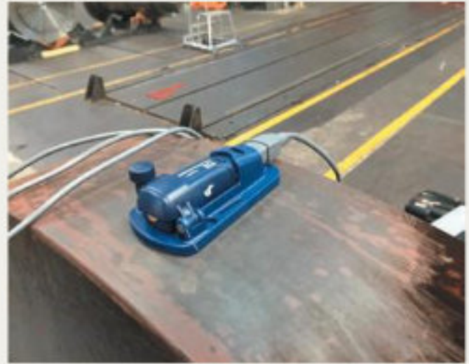
8. kép: Mérésees vizsgálat adatrögzítő segítségével - 2016 október (hpw)