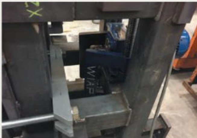
36.kép: VDSF eljárás alkalmazása; DM35 gépágy; vibrációs feszültségcsökkentés vibrációtompítással, Dulliken - 2018 február (hpw)