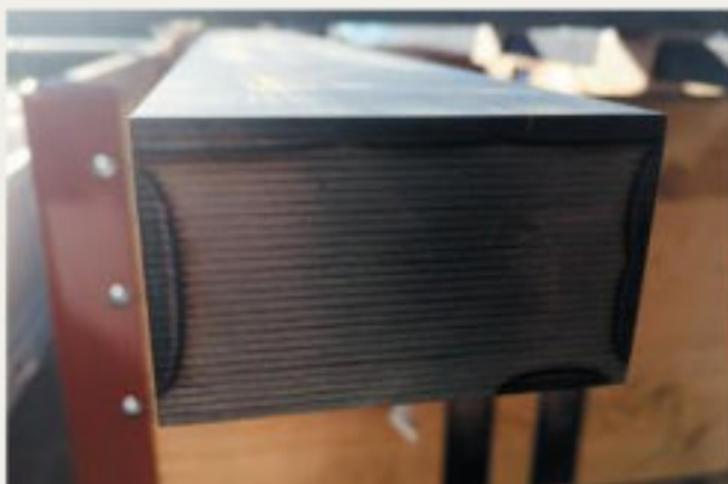
30.kép: Lézerrel edzett acélalkatrészekvibrációs feszültségcsökkentése, Dulliken - 2018 február (hpw)