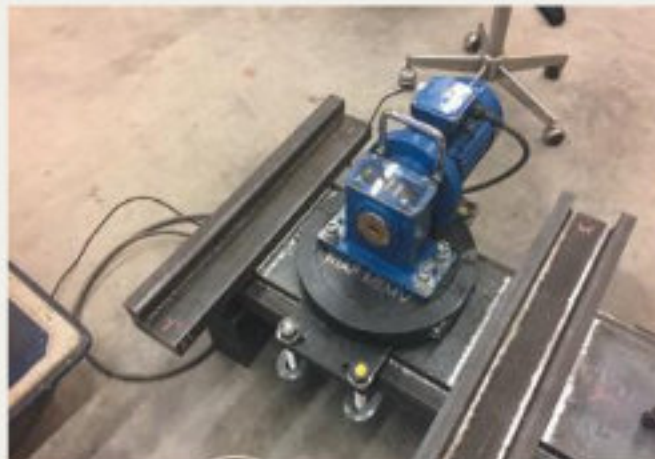
32.kép: WIAP CNC-multifunkcionális gép; DM35 vibrációs feszültségcsökkentés, Dulliken (hpw)