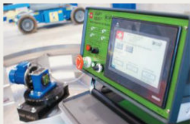
26.kép: WIAP vezérlőegység, a WIAP MEMV20 alapkészülékkel a háttérben -2017 augusztus (jw)