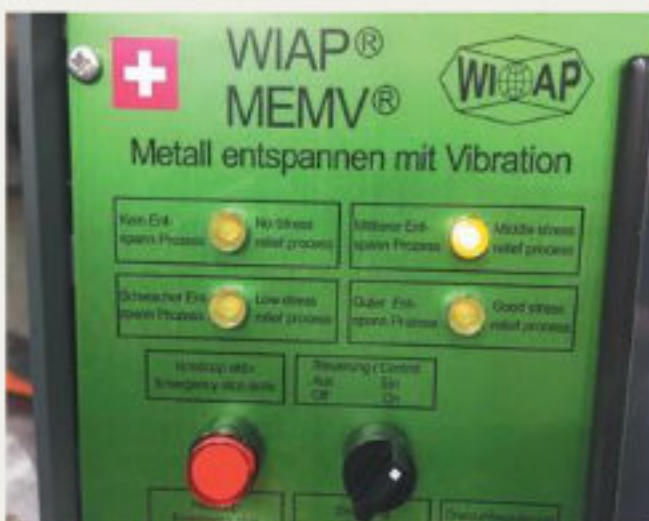
23.kép: Vezérlőegység WIAP MEMV E, Safenwil (hpw)