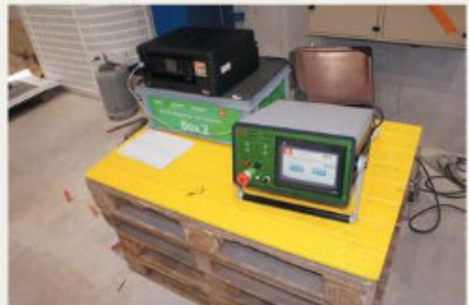
24.kép: Vezérlőegység WIAP MEMV nyomtatóval, és tárolódobozokkal -2017 augusztus (jw)

Mindeddig, a kis alkatrészeket, amelyek 100 kg alattiak, kevésbé találták megfelelőnek a vibrációs feszültségcsökkentésre. A WIAP AG ezt lehetőségnek tekintette arra, hogy kifejlesszen egy felfogó szerzámot, amellyel minden irány, és zóna egy befogással kezelhető. A befogó szerzámot oly módon terveztük, hogy többféle munkadarab-típusra kiterjeszhető legyen. Például a hosszú, vékony munkadarabok speciális igényeire is megfelelő megoldást tudunk kínálni. Az ilyen munkadarab minden pontját minden irányban rázatni kell, amit számításba vettünk a jelenlegi kialakításnál is, és az újonnan fejlesztett WIAP befogó szerzámonknál is.