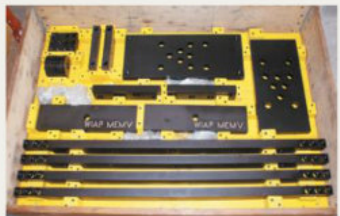
15.kép: Tengelyirányú felfogató készülék turbinakerekhez -2017 augusztus (hpw)

A berendezés rögzítése során számos új ismeretre tettünk szert. Az egyszerű, csavaros rögzítés már a múlté, ez technikailag már nem megfelelő megoldás. Egy sikeres folyamat döntő eleme egy olyan rögzítés, amely minden esetben átadja az energiát a munkadarabnak. Ennek érdekében több mint 50 új rögzítési megoldás található a termékínálatunkban, és még továbbiak hozzáadását tervezzük, hogy az ügyfeleink minden igényét ki tudjuk elégíteni.