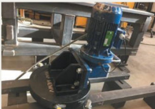
31.kép: 5 tengelyes MEMVfeszültségcsökkentés, Dulliken - 2018 február (hpw)