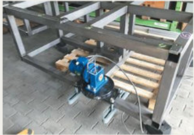
37.kép: Keretek vibrációs feszültségcsökkentése, Kelet-Svájc - 2018 január (hpw)