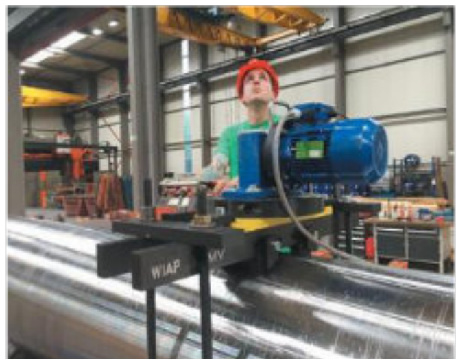
5.kép: Tengelyek a vibrációs feszültségcsökkentésnél (MEMV) - Jim Peter Widmer -2017 április (hpw)