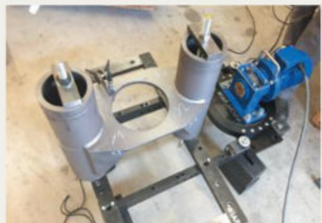
21.kép: Többfokozatú felfogatószerszám, munkadarabbal - 2017 október (hpw)