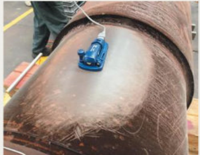
9. kép: Mérésees vizsgálat adatrögzítő segítségével, hőkezelt darabon -2016 október