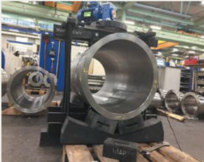
7.kép: Duplex-Cső-Teszt -2017 augusztus (hpw)