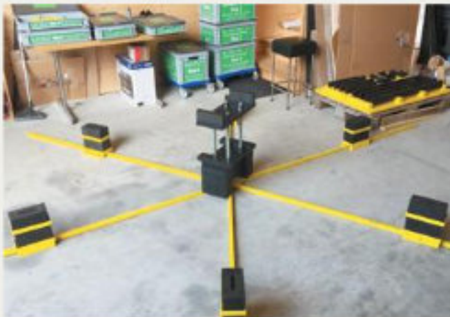
17.kép: Padlózati csillagállvány axiális rázókészülék rögzítéséhez - 2017 augusztus (hpw)