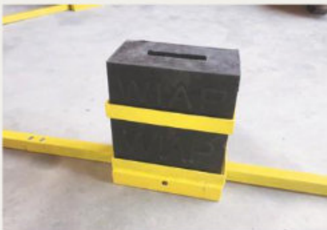
18.kép: Gumibetét a többfokozatú padlózati csillagállványhoz - 2017 augusztus (hpw)