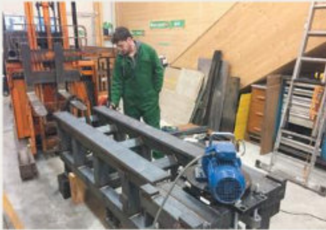
35.kép: DM35 gépágy; vibrációs feszültségcsökkentés, a hőkezelés kiváltására, Dulliken - 2018 február (hpw)