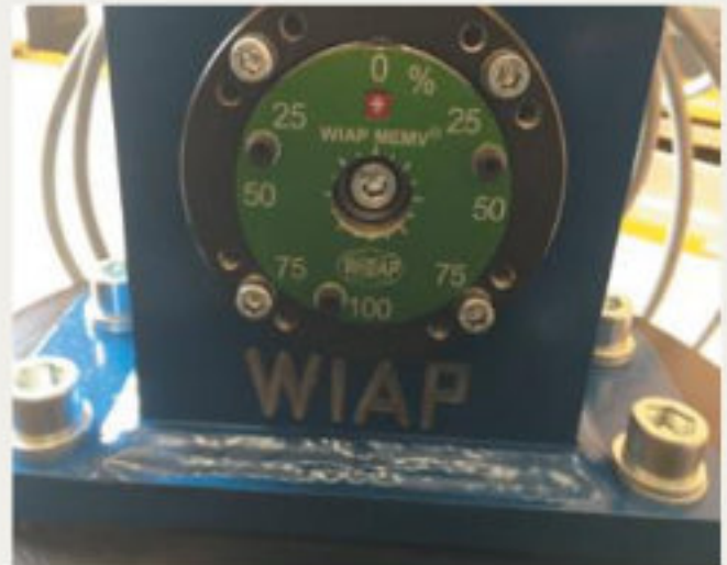
14.kép: Az új V20-as alapkészülék, százalékos excentrikus állítási lehetőséggel a különböző teljesítményszintek elérése érdekében -2017 október (hpw)

Az eddig elért sikerek ellenére, a WIAP AG munkatársai tudják, hogy további tesztek, és gyakorlati tapasztalatok szükségesek ahhoz, hogy a folyamatot még tovább lehessen optimalizálni. Ez kiterjed a perifériákra is, ahogy azt az elmúlt évek kibővített tartozékprogramja is mutatja.