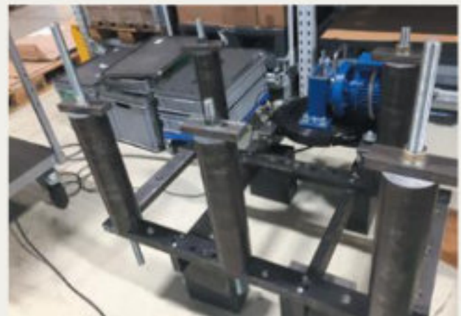
20.kép: Hat hengercső egy többfokozatú felfogató szerszámon, Berlin - 2017 augusztus (hpw)