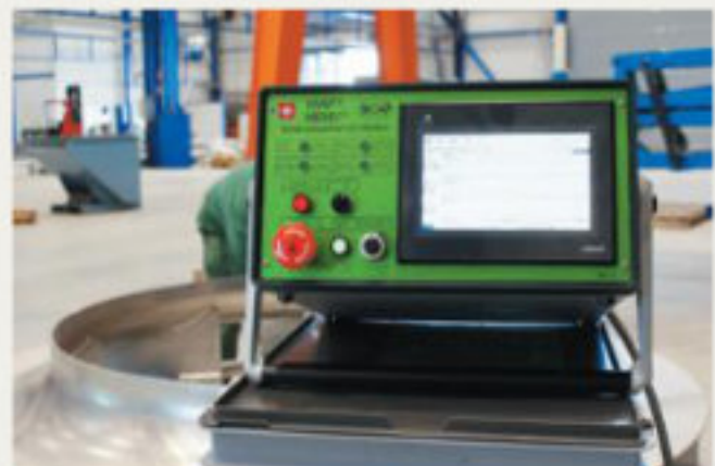
25.kép: Vezérlőegység WIAP MEMV 20E, (jw)

Mindeddig, a kis alkatrészeket, amelyek 100 kg alattiak, kevésbé találták megfelelőnek a vibrációs feszültségcsökkentésre. A WIAP AG ezt lehetőségnek tekintette arra, hogy kifejlesszen egy felfogó szerzámot, amellyel minden irány, és zóna egy befogással kezelhető. A befogó szerzámot oly módon terveztük, hogy többféle munkadarab-típusra kiterjeszhető legyen. Például a hosszú, vékony munkadarabok speciális igényeire is megfelelő megoldást tudunk kínálni. Az ilyen munkadarab minden pontját minden irányban rázatni kell, amit számításba vettünk a jelenlegi kialakításnál is, és az újonnan fejlesztett WIAP befogó szerzámonknál is.