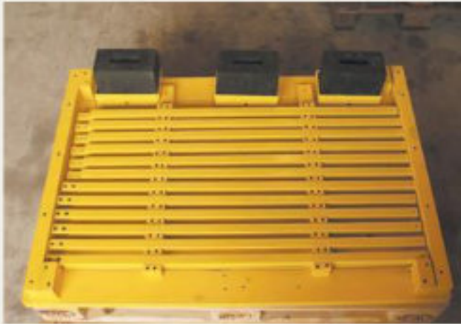
16.kép: Padlózati csillagállvány gumibakokhoz - 2017 augusztus (jw - Jim Peter Widmer)