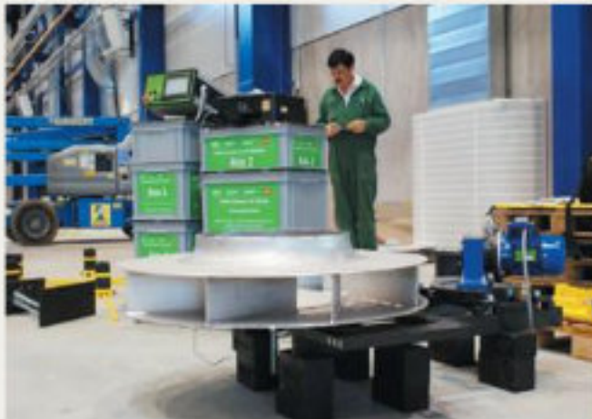
22.kép: Turbina egy többfokozatú felfogatószerzámon -2017 augusztus (jw)