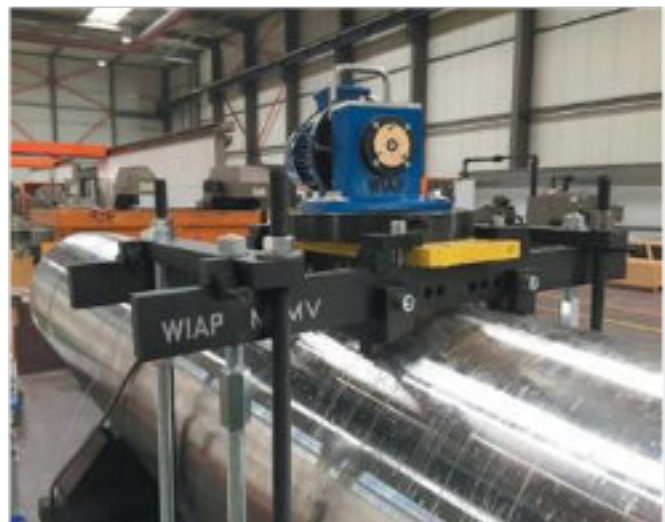
4.kép: Kezelési folyamat - 2017 április (hpw)