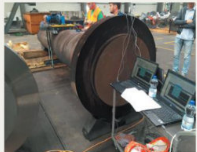
10. kép: Mérésees vizsgálat több adatrögzítő segítségével, jegyzőkönyvvel dokumentálva - 2016 október (hpw)

Ezeket a mérési pontokon vizsgáljuk a gravitációs erőbeli ( 9,81 \text{ m/s}^2 ) különbséget a kezelés előtt és után.