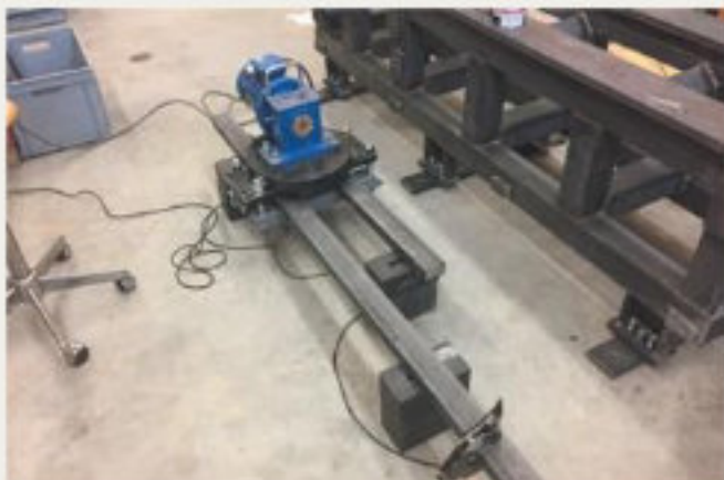
29.kép: Betétben edzett vezetősívek kezelése a MEMV eljárással, Dulliken - 2018 február (hpw)