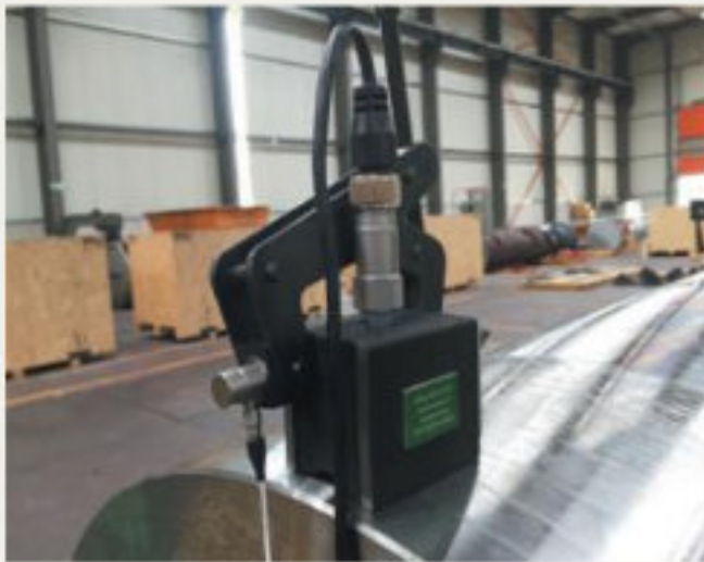
28.kép: Mérőszondák MEMV -2017 július (jw)

Már évekkel ezelőtt a WIAP AG felismerte azt a feszültségcsökkentő módszert, amelyet az előbbiekben már részleteiben kifejtettünk. Ez a sok éves tapasztalat kombinálva a jelenlegi bonyolult teszteredményekkel, olyan modern üzemben egyesült, amely magas minőségben, célzottan tud gyártani nagy precizitású eszközöket. A WIAP AG tovább akarja adni az általa összegyűjtött tudást a már bemutatott eljárásban rejlő óriási lehetőségekről az ügyfeleinek, hogy a fejlődést folyamatosan ösztönözze.