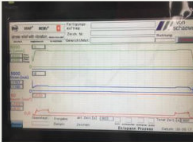
27.kép: Vezérlőegység WIAP MEMV: képernyőkép - 2017 július (jw)