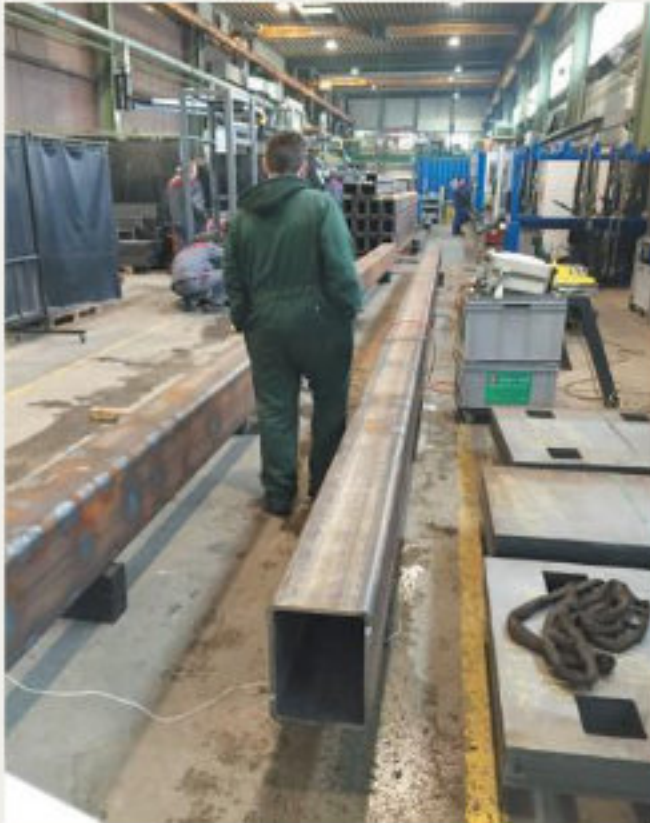
13.kép: Lánggal egyengetés: MEMV-vibrációs teszt, és az eredmények jegyzőkönyvezése (hpw)

Ezzel szemben, az olyan csövek, amelyekben a feszültséget a MEMV® technológiával csökkentették, egyenesek maradtak, a soron következő feldolgozás még egy tized milliméterrel sem torzította őket! Ezzel szemben a lánggal egyengetett, de nem feszültségmentesített munkadarabok a feldolgozás után további több milliméterrel görbültek. A méréseink bizonyítják, hogy a vibrációs kezeléssel a feszültségek ott épülnek le, ahol azok az anyagban valóban találhatóak. Továbbá a lánggal történő egyengetés egyrészt bizonyos anyagszerkezeti nyúlásokat eredményez, vagy egyes területeken az anyag folyáshatárértékét is meghaladhatja ez a kezelés. Ebből kifolyólag az anyag sosem áll vissza az alaphelyzetbe. Még akkor is, ha -szakszerű- kezeléssel egyenes marad a munkadarab, a felszín alatti zónákban lebonthatatlan feszültségek alakulnak ki. A MEMV® eljárással viszont nem okoz problémát elérni ezeket a területeket, és így kiegyenlíteni az itt található feszültségeket. Összefoglalva tehát sok gyakorlati példa mutatja, hogy a vibrációs technológia a hővel, vagy mechanikusan történő egyengetésnél kiválóan alkalmazható. Ezzel pedig beléphetünk a vibrációs feszültségcsökkentés új korszakába!