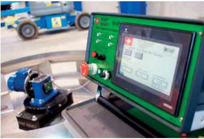
Bild 13: Steuergerät WIAP MEMV mit V20-Erreger im Hintergrund, Tampere, FI – August 2017 (jw)