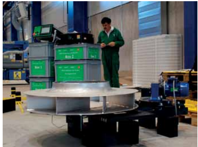
Bild 12: Impeller auf einer Mehrfach-Aufspannvorrichtung in Tampere, FI – August 2017 (jw)

Anregung, welche hohe Auslenkungen erwirkt, gar nicht notwendig ist. Bei den Schwerwalzen waren die G-Anregungen teilweise sogar nur besonders fein. Dennoch „verhielten“ sich diese Walzen bei der anschließenden Fertigbearbeitung wie eine geglättete Walze.