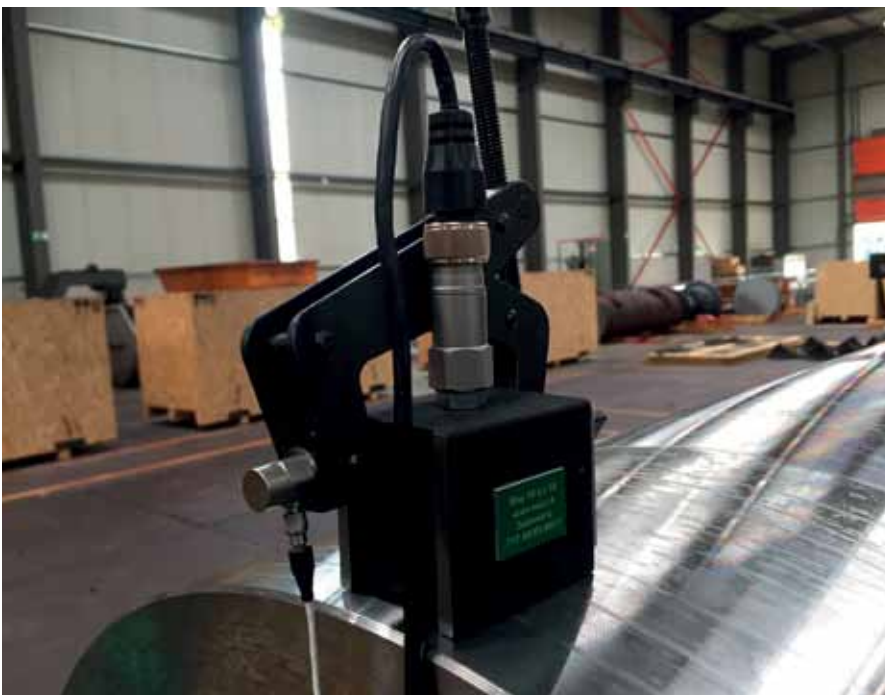
Bild 15: Messsonden MEMV – Juli 2017 (jw)

Schon in früheren Jahren hat die WIAP AG bei den eigenen Werkzeugmaschinen den Vorteil des hier näher beschriebenen Entspannungsverfahrens (stress relief) erkannt. Die langjährigen Erfahrungen in Kombination mit den Erkenntnissen aus den aktuellen aufwändigen Tests vereinen nun eine so hohe Qualität, dass sie sich für den Einsatz in einem modernen Produktionsbetrieb inzwischen ganz gezielt nutzen lassen, beispielsweise im hochgenauen Werkzeugmaschinenbau. Die WIAP AG will das Wissen über die enormen Möglichkeiten des Verfahrens weitergeben und auch anderen Anwendern zur Verfügung stellen, um die Entwicklung permanent voranzutreiben.