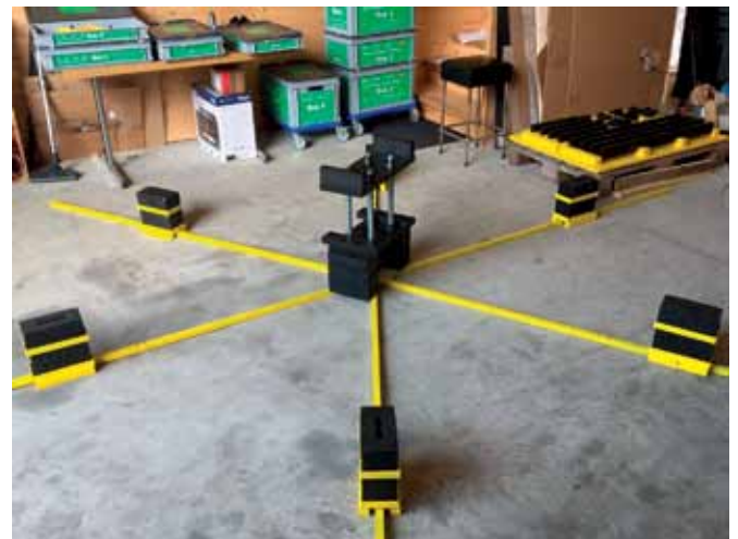
Bild 10: Sterngummi-Bodenhalterung mit Axial-Erreger-Befestigungsvorrichtung – August 2017 (hpw)