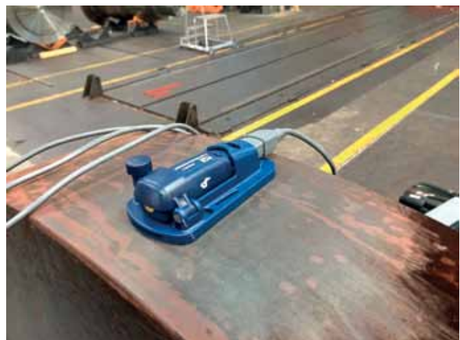
Bild 7: Sven Widmer bei einem Messtest mit 24 Messpunkten inklusive Protokoll-Erstellung – August 2017 (hpw)