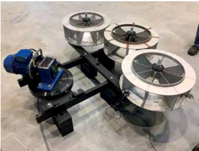
Bild 11: Drei Impeller mit einem Durchmesser von 800 mm auf einer Mehrfach-Aufspannvorrichtung, Tampere, FI – August 2017 (hpw)