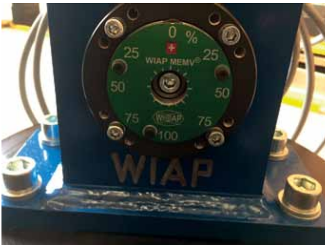
Bild 9: Neuer V20-Anreger mit verschiedenen Einstellmöglichkeiten in % für unterschiedliche Excenterstufen – Oktober 2017 (hpw)

gleich entspannt werden können. Das bedeutet nach dem bisherigen aktuellen Kenntnisstand, dass im Durchschnitt circa 60 % der Spannungen im Bauteil zwar erreicht werden, jedoch bis zu 40 % dementsprechend nicht. Je nach Bauteilart können diese restlichen nicht erreichten 40 % Spannungen auch weniger oder mehr sein. Die hochgenaue Messmethodik zeigte darüber hinaus auf, dass es zwischen kubischen und rotations-symmetrischen Bauteilen deutliche Unterschiede bei den Ergebnissen gibt. Aktueller Stand ist, dass die Schwingungen bei kubischen Bauteilen entscheidend weniger Querrichtungen erreichen. Diese Erkenntnis ist sehr wertvoll und zeigt auf, dass vor allem bei diesen Bauteilen ein Vielrichtungs-Vibrationsentspannen (neu MEMV genannt) zum Einsatz kommen muss. In die intensiven Untersuchungen zum Vibrationsentspannen hat die WIAP AG mit Weitblick dementsprechend seit dem Jahr 2014 bis heute circa CHF 350.000, als etwa 300.000 Euro investiert. Die messtechnischen Untersuchungen führten zu einigen wichtigen Erkenntnissen, die sich sowohl technologisch als auch wirtschaftlich nutzen lassen. Erstens ist belegbar, dass sich alle Zonen nur mit dem Mehrrichtungsverfahren (MEMV) anregen lassen. Zweitens zeigt sich, dass eine